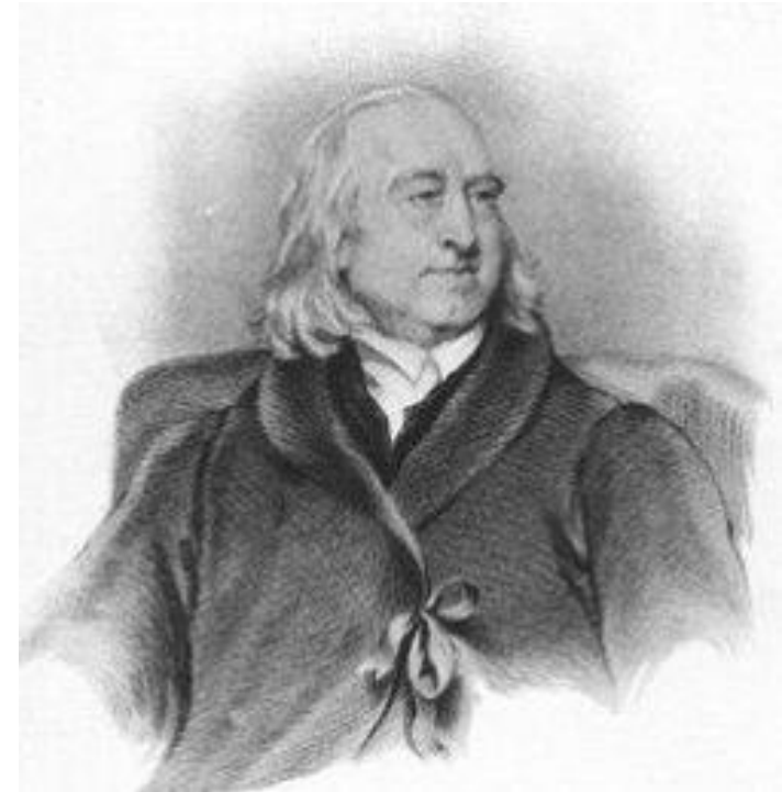
Jeremy Bentham (1748 – 1832)